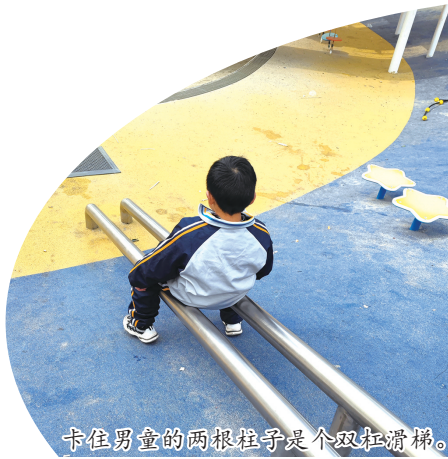
卡住男童的两根柱子是个双杠滑梯。