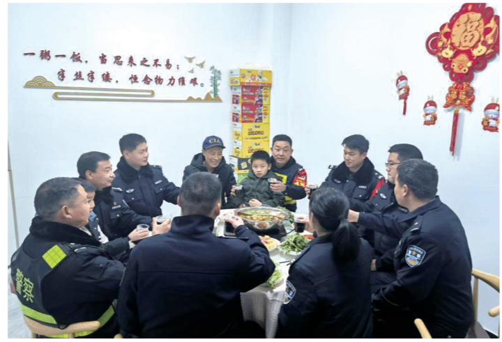
除夕晚上9点,黄龙派出所的民警们围坐在一起吃年夜饭。