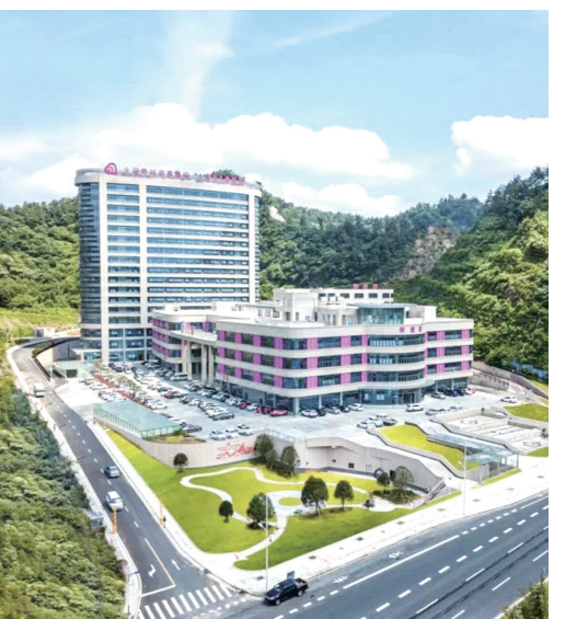
航拍市妇幼保健院新院区。

2022年,市妇幼保健院科研工作成果丰硕。1项省卫健委指导性科研、6项市级指导性科研项目通过立项;6项软科学结题,其中2项软科学项目获得市级三等奖;全年发表论文31篇,其中SCI10篇,核心论文18篇,普通期刊3篇;著书67人,其中主编2人,副主编18人,编委47人;实用新型专利17项。