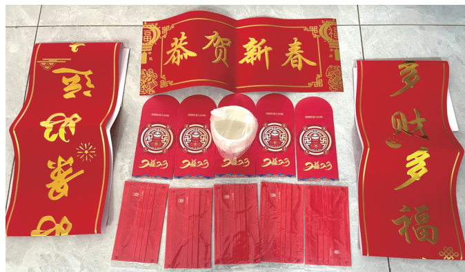
物业公司送给业主的新春大礼包。