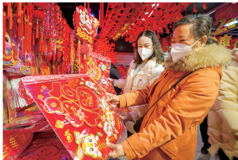
鄂西北小商品批发市场，市民在选购春联、福字等兔年新春饰品。图/记者 刘成臣