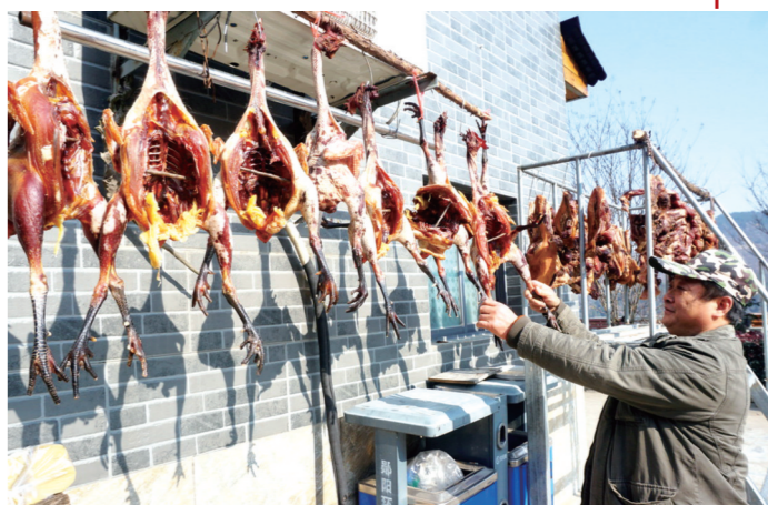
郧阳区村民在门前晾晒腊鱼、腊鸡、腊排等肉制品。新年临近，处处都是腊味香。