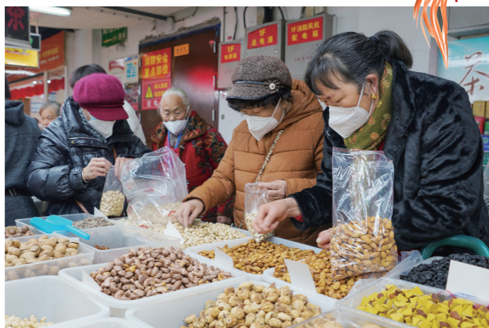
火车站日用品副食批发城，市民正在选购坚果、蜜饯等年货。