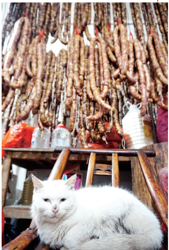
腊肠高挂，年味渐浓。