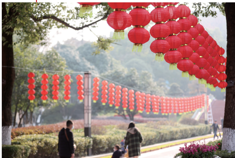
人民公园挂起大红灯笼，营造浓浓年味。