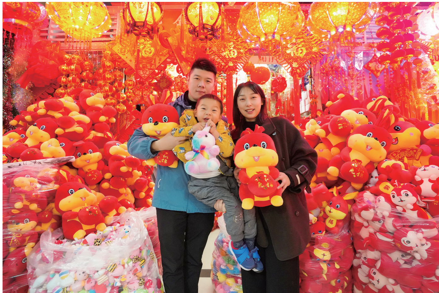
一家人在批发市场挑选兔年挂饰，红红火火喜迎新春佳节。