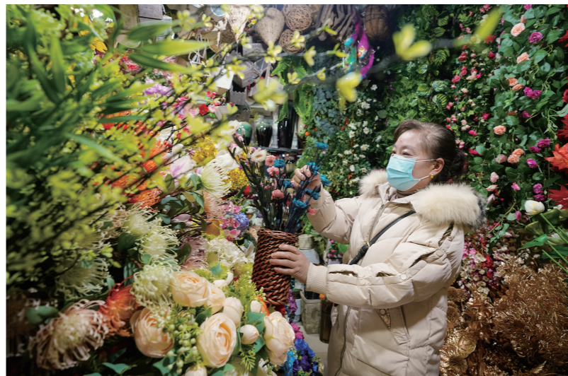
春节临近，到花卉市场挑选年宵花的市民越来越多。