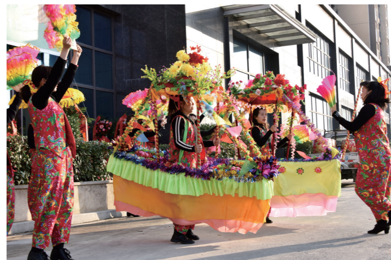
1月8日，在郧阳区柳陂镇大桥村，村民们积极彩排划旱船。2月4日（正月十四），郧阳区将在体育场举办“奋进郧阳·龙飞凤舞迎玉兔”民俗花灯秧歌展演巡游活动，届时将有近50支民俗花灯队和秧歌队踩街巡游。