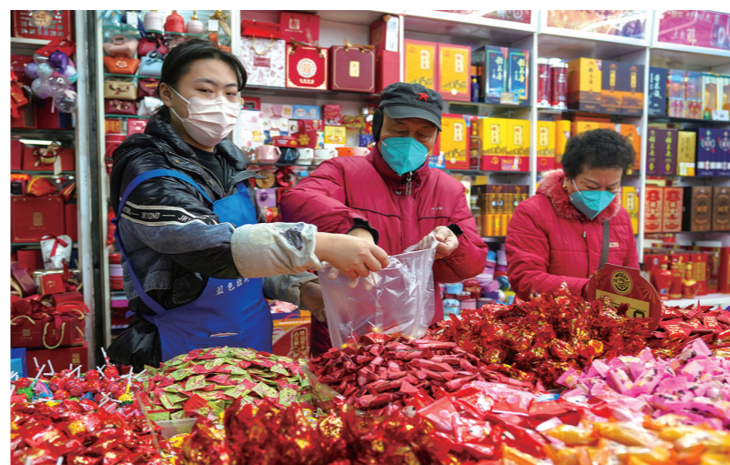
商超年货销售旺，市民选购忙。