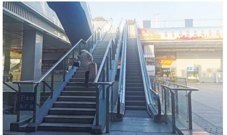
乘客拖着沉重的行李走步梯。