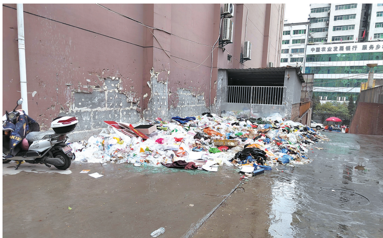
小区一角堆满了垃圾。