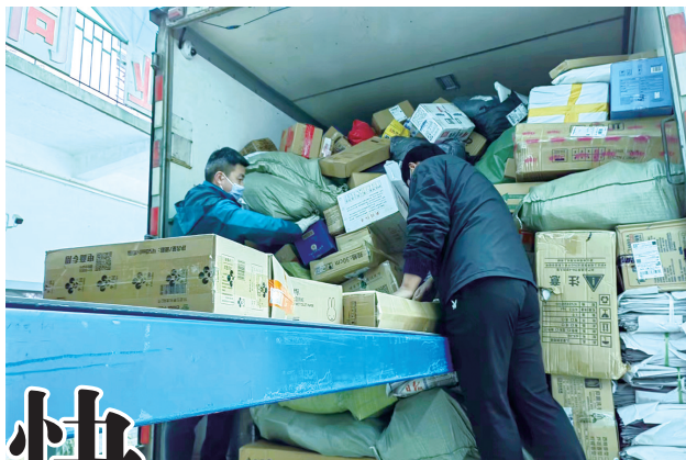
城区多家快递企业目前正加紧清库存。