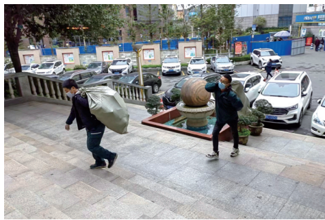
不少快递员带病坚持送快递。