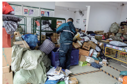
快递企业职工普遍返岗,运力不足问题缓解。