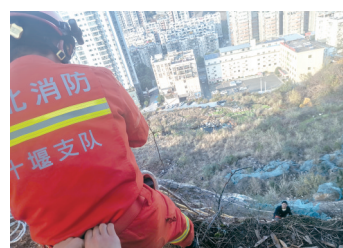
消防人员通过努力，顺利将被困男子救上来。

到达被困人员所在位置后，消防救援人员立即寻找有利地点，随后开始设置安全绳索展开救援。为防止男子踩空造成二次伤害，消防救援人员立即为男子穿戴安全吊带、挂安全挂钩、系绳索等，并安排两名消防救援人员放下软梯，拽住安全绳，引导被困人员向山上攀爬。经过半小时的紧张救援，被困男子成功获救。