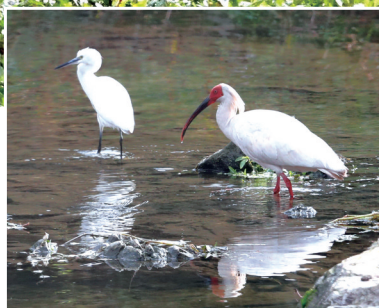
朱鹮长长的黑嘴向下弯曲，鼻尖还带有一点儿红色。

环境保护成效显著。丹江口湿地保护区目前分布有国家重点保护野生动物18目69科368种，较2017年新增50余种，居湖北省前列。