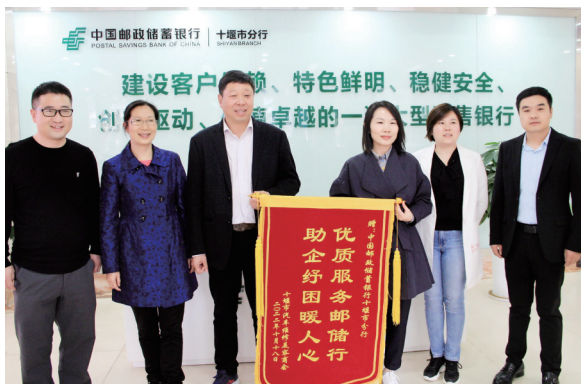
十堰市汽车维修美容商会向邮储银行十堰市分行送锦旗。

该行积极为乡村振兴贡献金融力量,在房县,邮储银行十堰市分行集中开展整村授信工作,共增加177个信用村,累计授信2300余万元,现场放款375万元,全县20个乡镇的行政村全部建成信用村;在郧阳区,该行在南化塘镇南化村积极探索“整村授信+村银共建”模式,打造十堰信用村样板,已评定信用用户463户,授信69户、1438万元,本年新发放贷款39户、776万元。