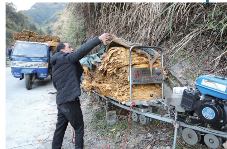
为了更加精准、高效地保护水资源,竹山县柳林乡改造升级传统产业,全面推广无公害种植和以煤(电)代柴烘烤技术。

七百里堵河,自南向北,穿群山,纳百川,亿万年来奔流不息,不断续写着历史与未来的传奇故事。