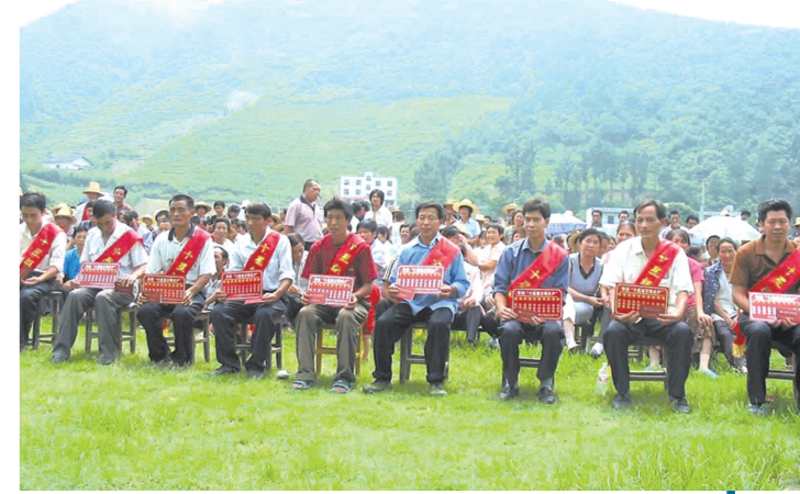
竹山“十星级文明农户”创建活动成为享誉全国农村精神文明建设的一张亮丽名片。