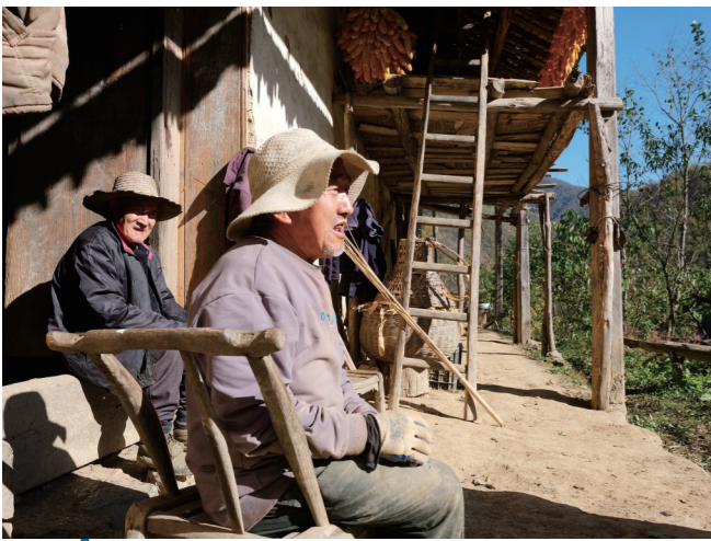
竹山人亲切地称堵河为“母亲河”。对于许多老人来说,堵河陪伴了他们一生,就是家乡的代名词。