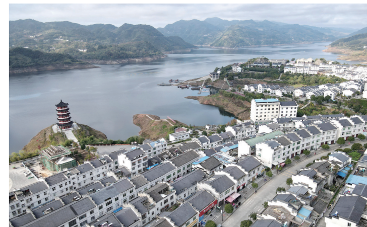
堵河承载着古庸文明,养育了两岸苍生,造福了亿万人民。图为滨临堵河潘口水库的竹山县上庸镇整洁美丽,风景如画。

隆冬时节,沿堵河行走,随处可见鸚鵡(音pi ti)、白骨顶鸡、鸳鸯等珍稀鸟类集群飞翔,它们已成为这里的“常客”;在湖北堵河源国家级自然保护区,红外相机多次拍摄到国家濒危动物豹猫,国家二级保护动物红腹锦鸡、黄喉貂、斑羚、鬃羚、猕猴等。今年5月份,工作人员还与黑熊面对面遭遇。目前,竹山县有国家重点保护野生动物69种,其中,国家一级重点保护野生动物13种,国家II级重点保护野生动物56种。