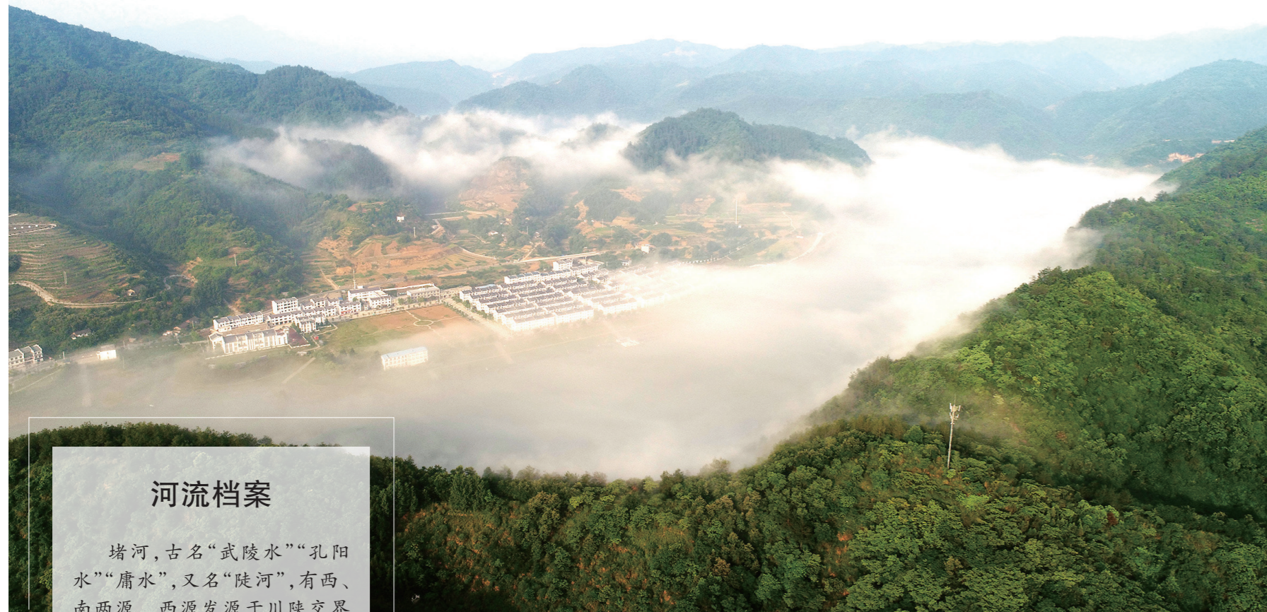
堵河流域全境皆山,属于山地弯曲河型。这种独特的地理环境,造就了堵河独特的美、秀、俊。