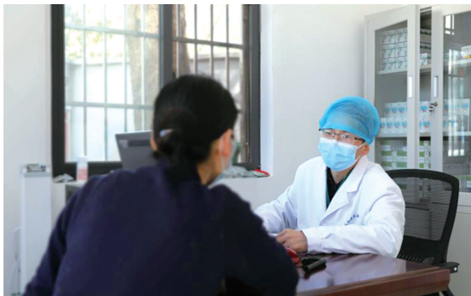
一名疑似患者前来西苑医院咨询。