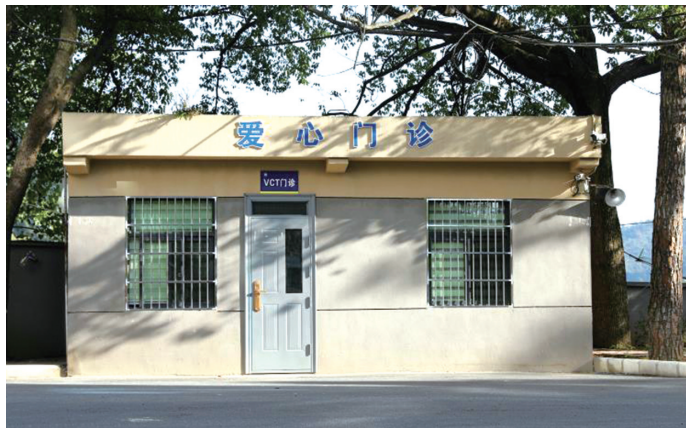
西苑医院为患者设置了爱心门诊。