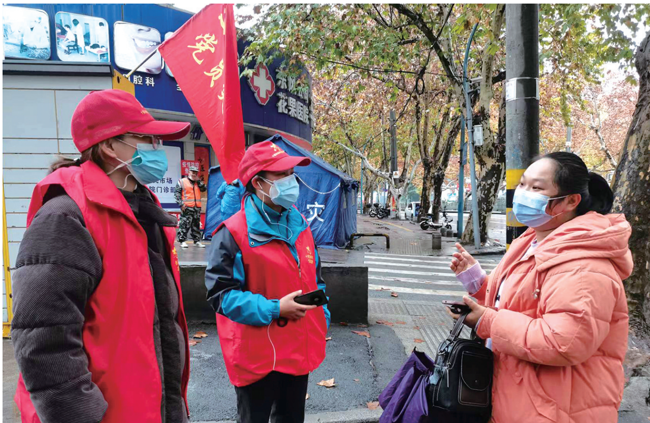
红卫街道王湾社区下沉党员为就医市民提供帮助。

近日疫情防控战役打响以来,我市成千上万名党员干部、社区志愿者挺身而出,勇敢“逆行”,从网上到网下,从白天到黑夜,在战疫的各个环节,处处都能看到他们的身影。他们通过不同形式的志愿服务投身这场战斗,冲锋在前,勇挑重担,用实际行动演绎“我是党员我先上”的责任担当,用无私奉献展现了“奉献、友爱、互助、进步”的志愿精神。这一抹抹“志愿红”,为抗击疫情注入温暖的力量。