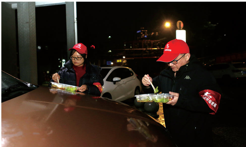
为了确保岗位24小时有人值守,下沉党员干部把汽车引擎盖当桌子,轮换吃盒饭。