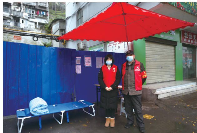
熊家湾社区一小区门口,两名志愿者在细雨中坚守,旁边的一张简易折叠床就是他们半夜休息的地方。