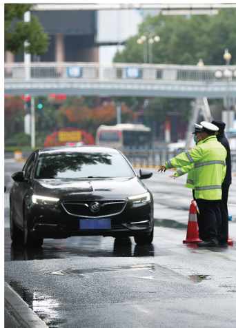
交警、民警全天候坚守在马路上。