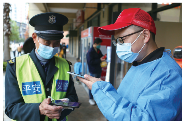
在各个小区核酸监测点都能见到志愿者忙碌的身影。