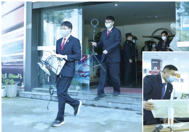
▲当天行动共派出警车13辆、干警70余名,历时8个小时,执法人员腾空场地近9000平方米。

在此前的数次执行中,十堰市中级人民法院多次依法张贴封条、清场公告,督促被执行人腾退房屋,但某宸公司阻挠,拒不履行执