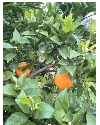
这棵树上,同时出现金黄色橙子和白色的小花。