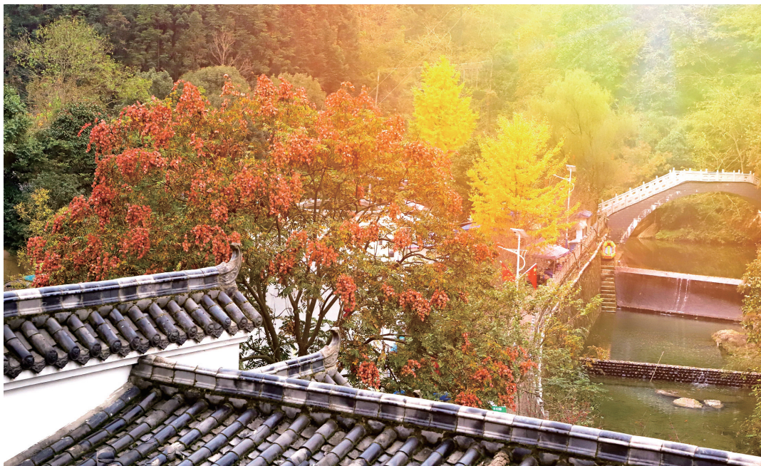
东沟秋色如画。