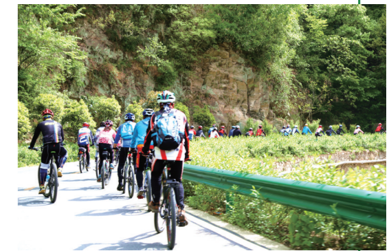
晴日到东沟村骑行,既欣赏了美景又锻炼了身体。

“一碧绿叶遮苍穹,十里荷花十里香。”清风之中,碧波随风翻滚,万柄红荷摇曳,东沟的荷花出落得静美如斯。荷花无言,可它捧着清香的呓语,将深碧的绿意送进人们的凝望里,即使烈日炎炎,只要你能静对,浑身上下便会流淌着幽幽的清凉。