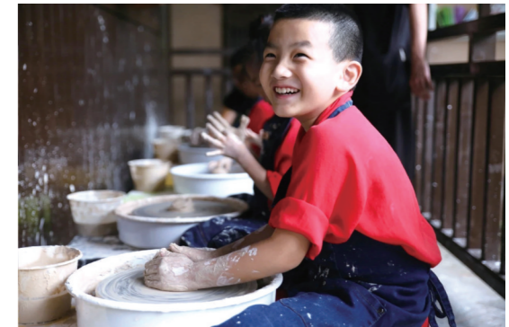
动手做陶艺作品很快乐。资料图片

念情谷猕猴园是东沟村景区的一大亮点,也是鄂西北最大的野生猕猴聚集区。这些猴子不怕人,游客可以和它们嬉戏玩耍。它们是这里的精灵,非常可爱,极通人性,见人不惊,与人同乐,给游人带来无数欢乐。