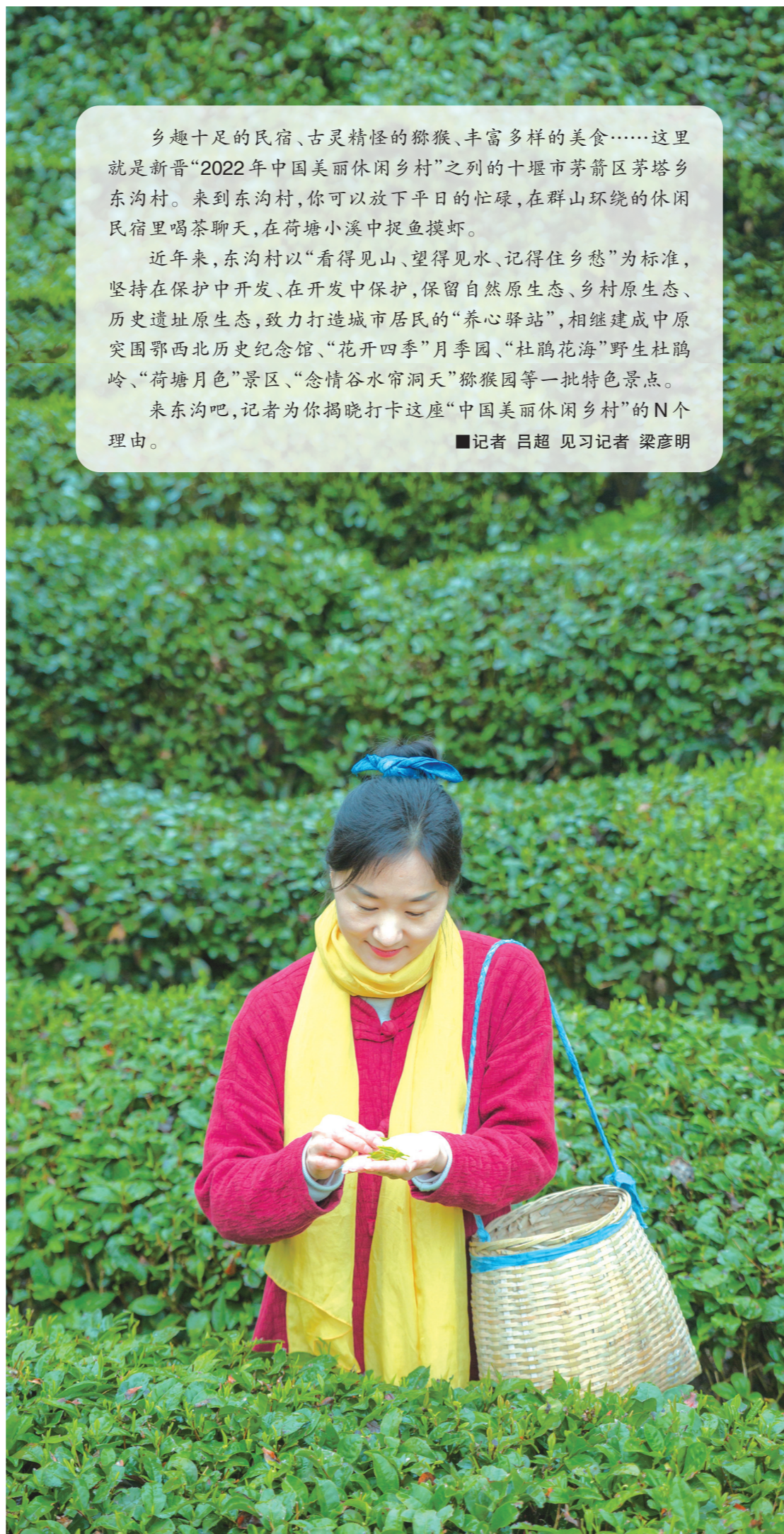
“绵绵细雨卸红妆,远山近绿采茶忙。”

乡趣十足的民宿、古灵精怪的猕猴、丰富多样的美食……这里就是新晋“2022年中国美丽休闲乡村”之列的十堰市茅箭区茅塔乡东沟村。来到东沟村,你可以放下平日的忙碌,在群山环绕的休闲民宿里喝茶聊天,在荷塘小溪中捉鱼摸虾。