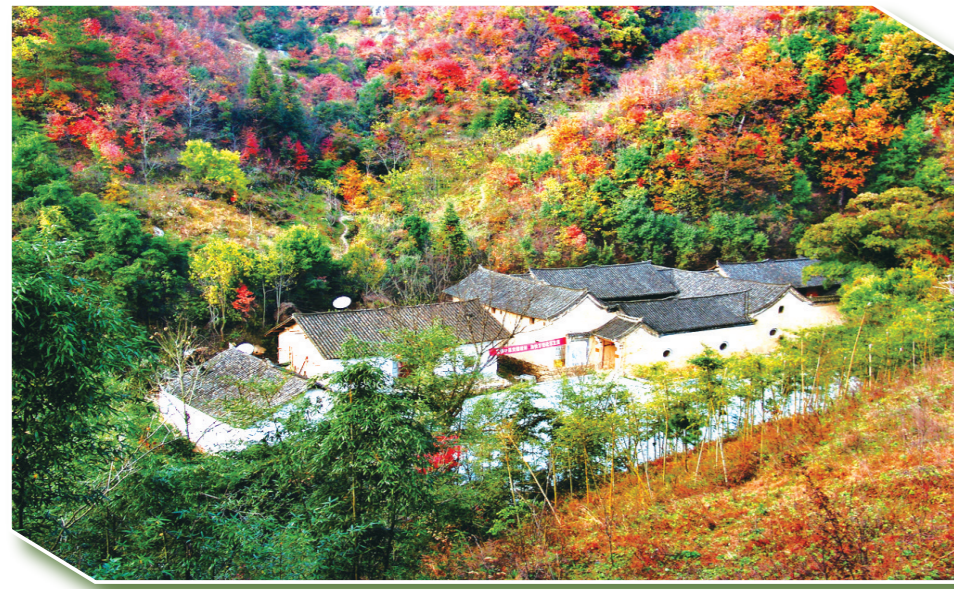
东沟村建有中原突围鄂西北历史纪念馆。来这里,可以了解党的历史、缅怀革命先烈、接受革命传统教育和爱国主义教育。