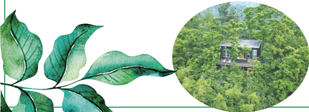
东沟民宿隐于群山树海间,宛如一个世外之地。 资料图片

在途经爱国主义教育基地的路上,会邂逅“花开四季”月季园,这里培育有十几个品种的月季,面积为60余亩。每年初夏,园中月季盛开,浪漫唯美。