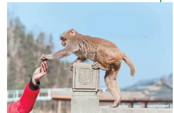
和念情谷里的猕猴互动,是东沟村游玩的特色项目。

在杜鹃岭,沿着2000余米长的环山步道一路向上,你可以登上郁郁葱葱的山顶,欣赏火红的杜鹃花在青山绿树之间热烈、绚丽的盛开美景。每朵花都空灵而细腻,如诗如画,美不胜收。