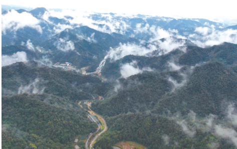
从空中俯瞰东沟村。