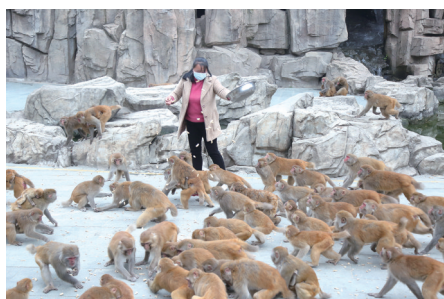
饲养员给园内猕猴喂食花生。

如今来到东沟村,山上草木葳蕤,农家院内花草宜人。蓝天、白云、庭院、绿树、红花构成了一幅幅动人的农家风情画,吸引着众多游客。