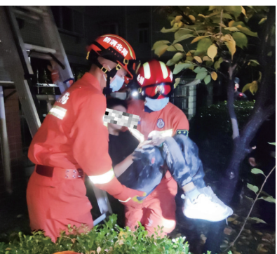
男童被成功救下来。