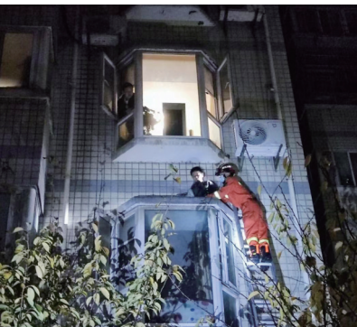
消防员悄悄爬到男童所在位置,并将他小心抱下来。