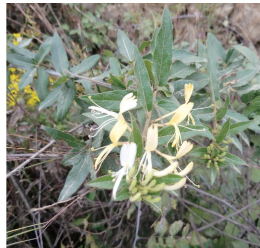
虽然已经立冬了,但这里的金银花还在开放。

金银花在立冬后依旧开花,通常情况下不太多见。专家称,植物非常规季节开花,与其本身遗传特性、土壤肥力条件与管理水平等密切相关。