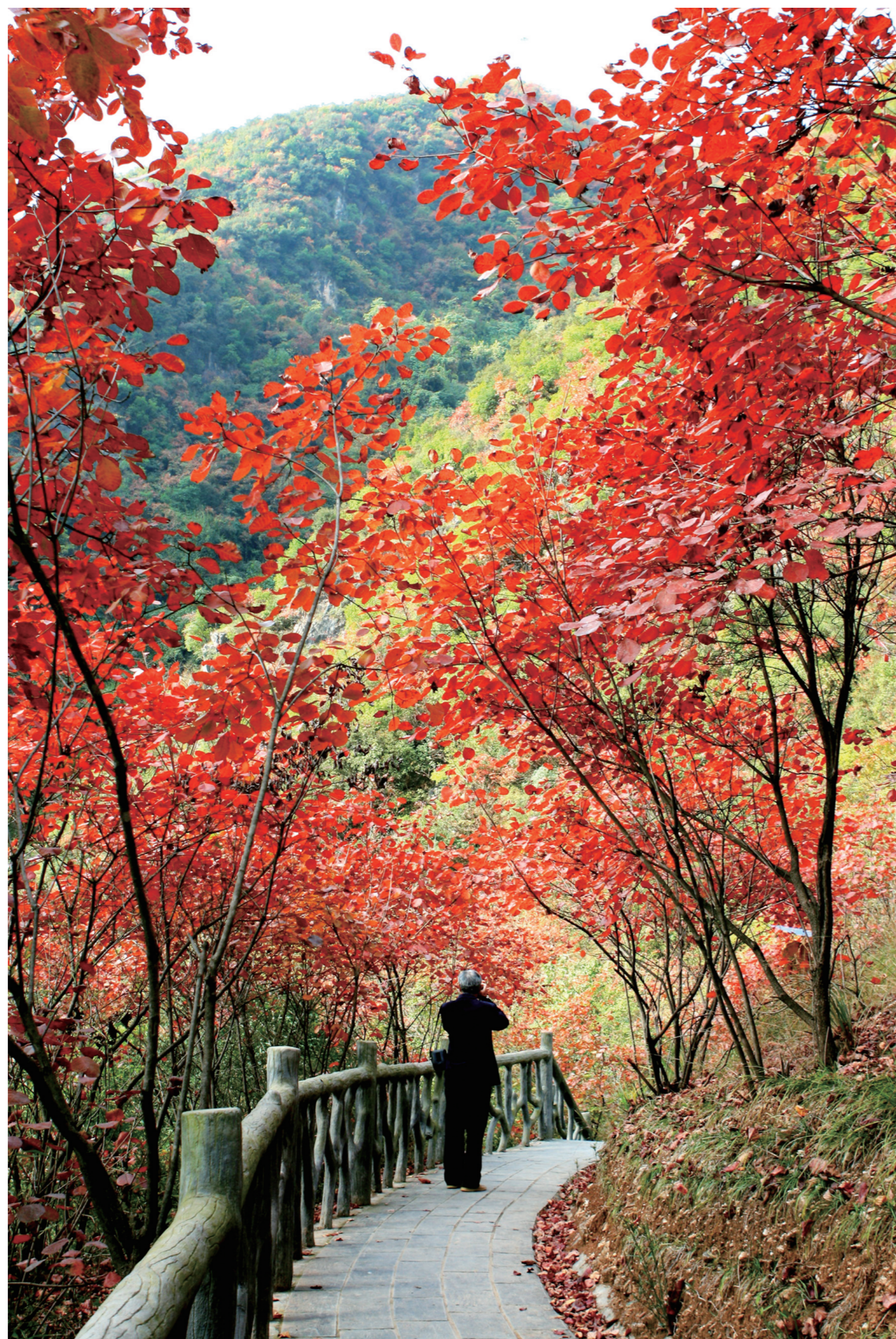
“寒山十月旦，霜叶一时新。似烧非因火，如花不待春。”图/黄江平