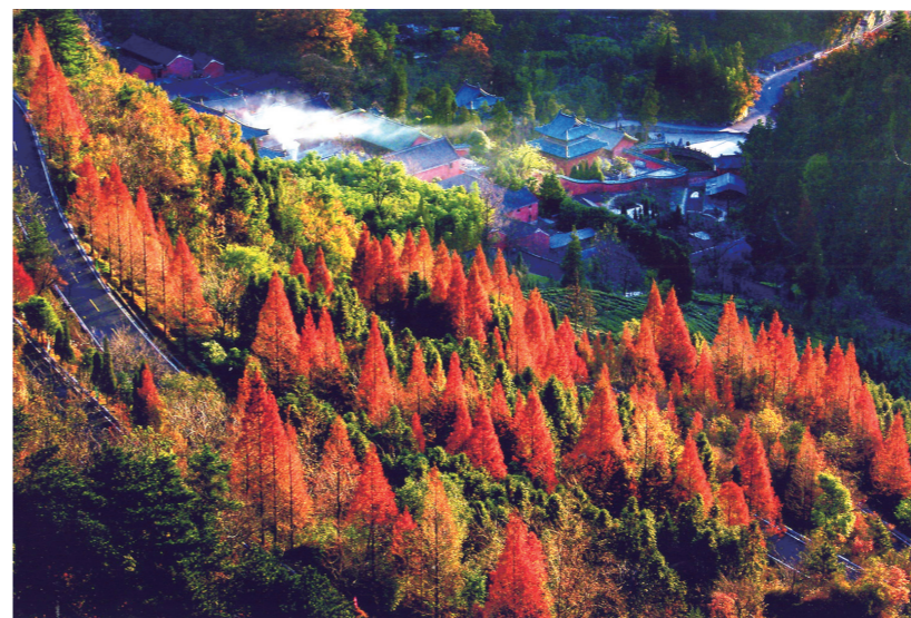
“霜林谁点染，老翠见深红。”魏建明摄于紫霄宫。