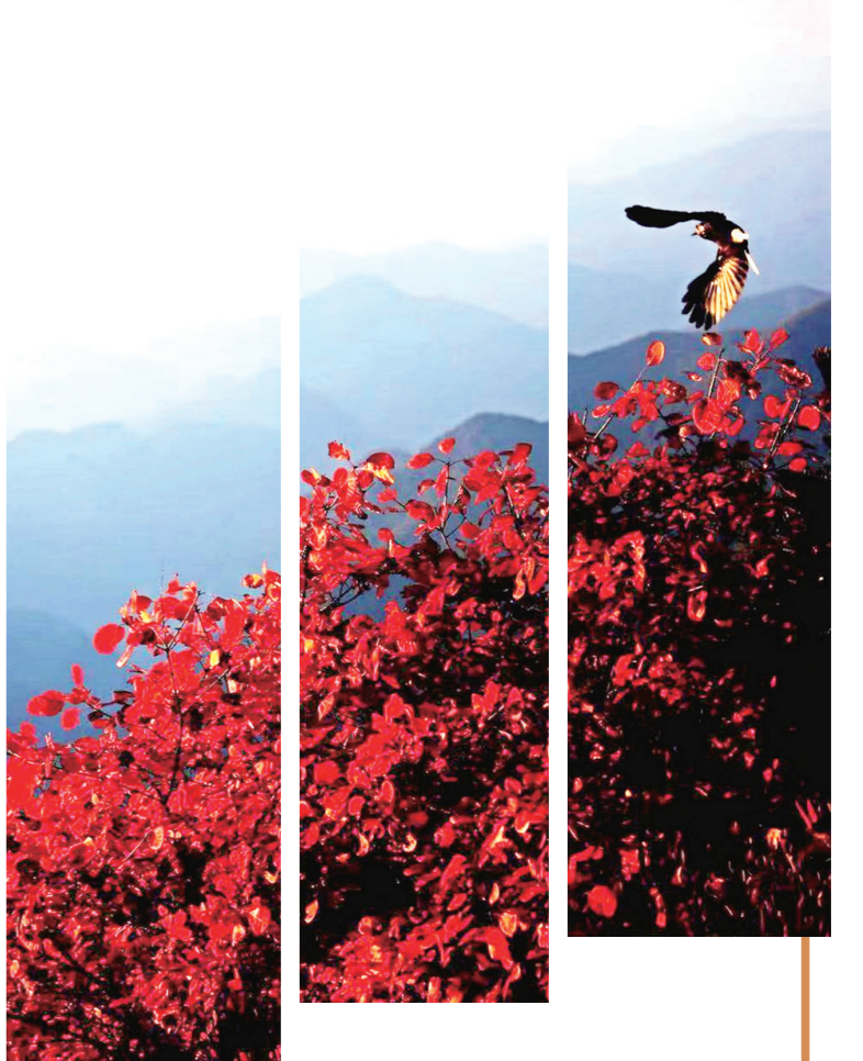
“自古逢秋悲寂寥，我言秋日胜春朝。晴空一鹤排云上，便引诗情到碧霄。”杨洪霞摄于郧西湖北口