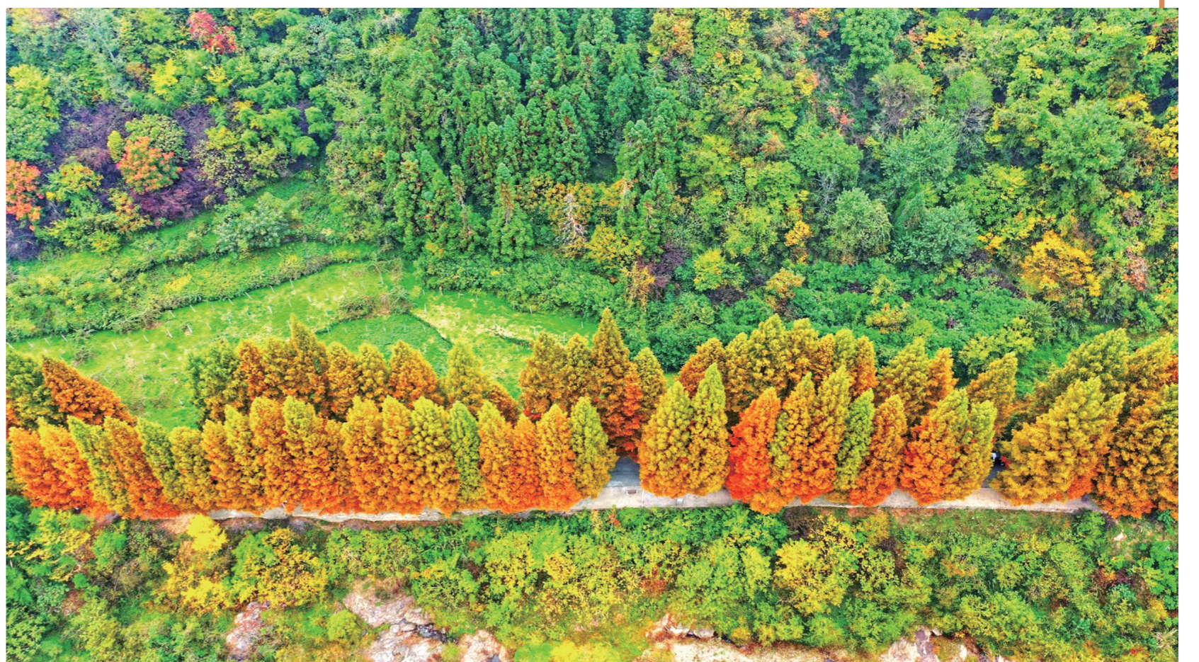
“万花都落尽，一树红叶烧，谁怜惟薄力，添与江山烧。”