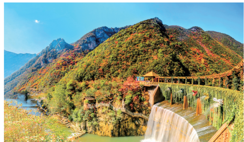
“秋水浸寒空，霜飞落叶红。”黄江平摄于郧西五龙河