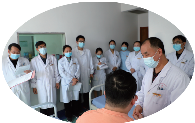
市中医医院专家带领中医规培学员，深入病房学习专业技术。

据悉，市中医医院已成为湖北中医药大学临床学院，也是陕西中医药大学、湖北医药学院的教学医院。在即将投入使用的综合大楼建设项目中，市中医医院规划了4层近6000平方米作为中医住培教学场地使用；建设2000平方米的技能训练中心，设置技能操作间13个、理论教室4个，引进中医技能训练、理论在线考试等系统，配备心肺听诊模型、内科胸穿腰穿模型、急诊气管插管模型等临床教学教具。医院综合大楼建成后，将极大改善规培教学条件，成为区域内一流的中医药人才培养基地。