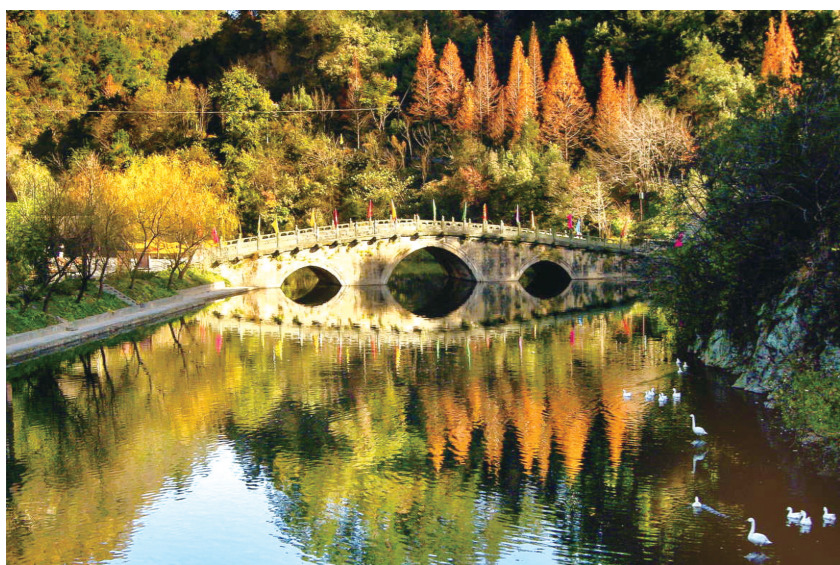
“一天秋色翠如描。山秀水明相照，烟树映溪桥。” 网友“佚名”摄于武当山逍遥谷