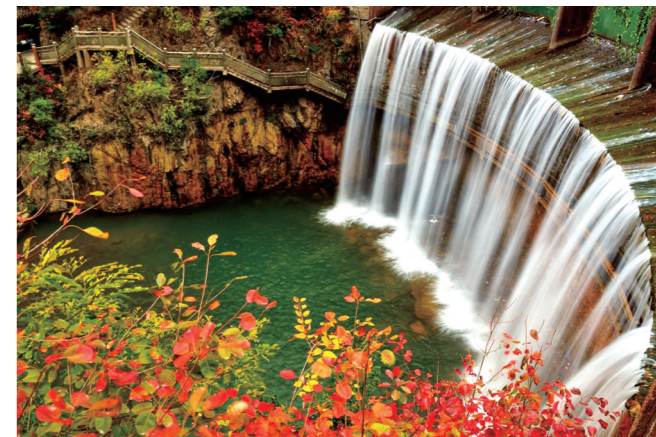
“红叶满寒溪，一路空山万木齐。” 张建波摄于郧西县五龙河景区