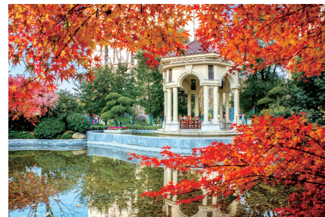
“一川红树迎霜老，数曲青溪绕寺深。”