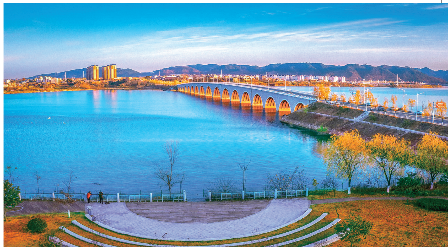
“山映斜阳天接水，芳草无情，更在斜阳外。”于郧阳区柳陂镇十七孔桥