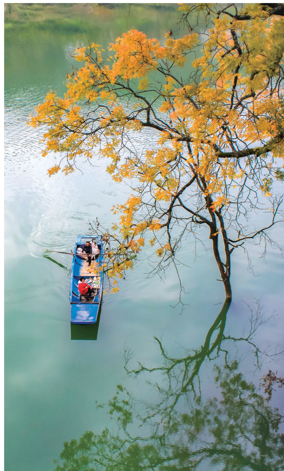
“满载一船秋色，平铺十里湖光。波神留我看斜阳，放起鳞鳞细浪。”