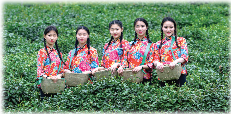
每到采茶季节,采茶姑娘忙采茶。