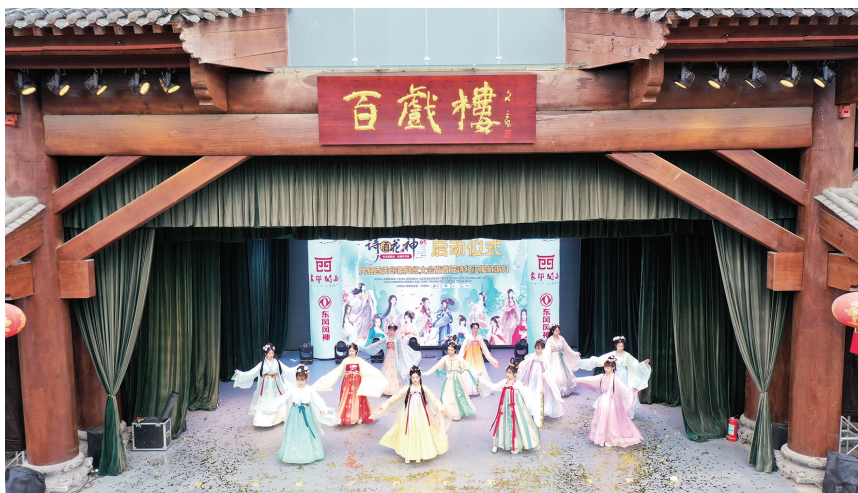
每至假期,房县西关印象景区便会举行形式多样的文艺节目。