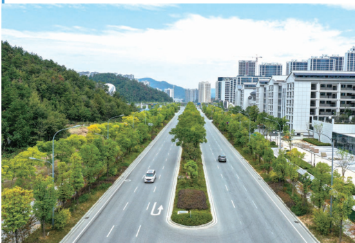
2020年初,紫霄大道(原火箭路)全线通车。