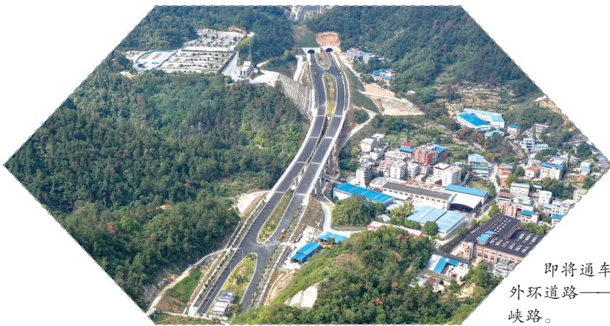
即将通车的外环道路——三峡路。