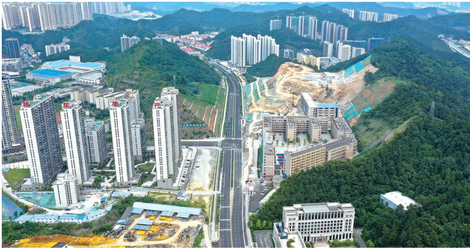
近几年,林荫大道一号线、二号线、三号线相继建成通车。