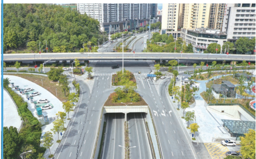
上海路—北京路—重庆路交会处建成三层立交,大大缓解了通行压力。

一条条道路、一座座桥梁,带动了一片产业,带富了一方百姓,正加速十堰从交通大市迈向交通强市。目前,十堰已基本构建起以高速公路为骨架、国省道为支撑、县乡公路为脉络、村组公路为基础,水运、航空、铁路齐头并进,内联外畅、相互衔接、层次分明的综合立体交通大格局。