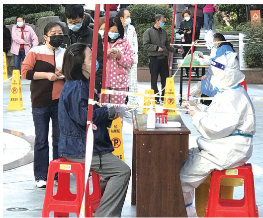
北京小镇居民有序排队做核酸。