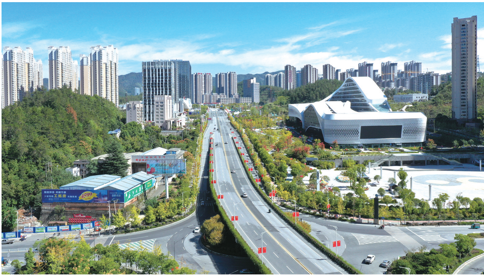
10年后的今天,熊家湾转盘附近已建好广场、游园、商场、小区,一片繁华。