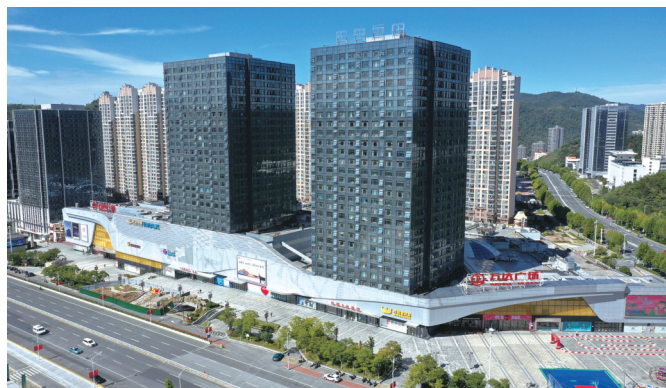
如今,万达广场已成为十堰城市时尚生活中心、潮流生活新地标。

作为我市目前占地面积最广、投资规模最大、体育场馆最多、功能设施最全的体育惠民工程,十堰奥体中心具备承接省级以上综合赛事和全国及国际单项赛事的能力,成为众多活动的首选举办地。今年7月,多项省级体育赛事在十堰奥体中心陆续举行,来自全省各市州的运动员在现代化的场馆里同台竞技,尽情享受比赛带来的乐趣。与此同时,十堰奥体中心高水平的服务保障成为赛事的一大亮点,专业、细致、周到的服务赢得参赛人员的广泛赞誉。