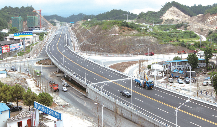
2012年10月,北京北路延长线刚刚建好,熊家湾周边还是一片“荒凉”。