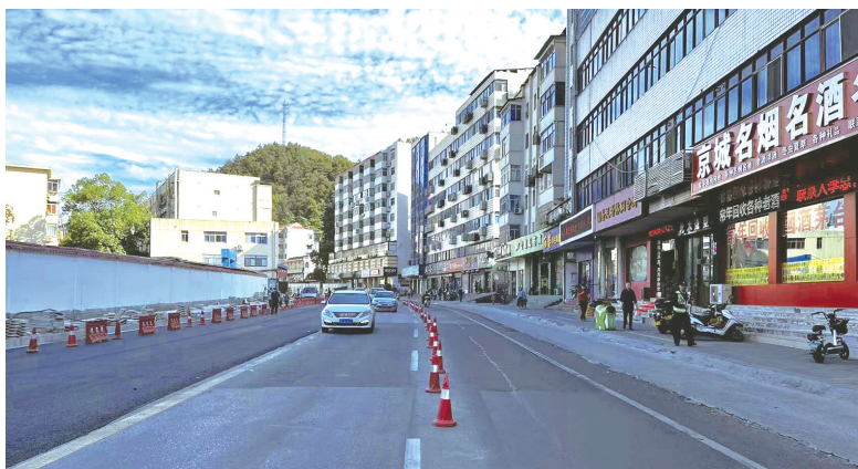
柳林路北侧柳源农贸市场—黄花巷、老柳林宾馆—老行署两段道路昨晚开放通行。