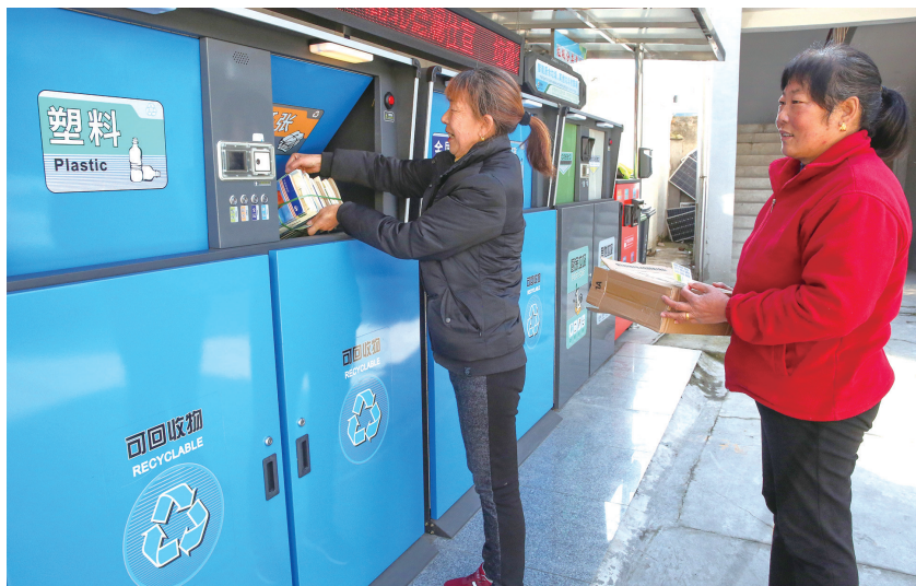
我市大力培育垃圾分类等文明新风尚,引导群众养成绿色环保生活方式。(资料图片)