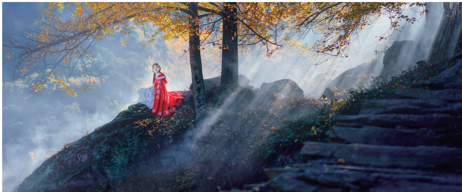
茅箭区茅塔乡大沟村，缕缕阳光透过枝叶照进幽静山林，女孩一袭红衣蓦然回首，带你穿越到古风悠悠的汉唐盛世。