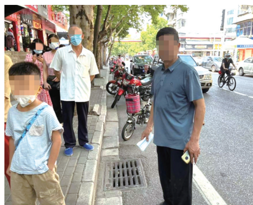
广东路一身床蓝色上衣大叔不戴口罩。