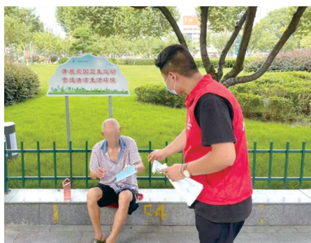
朝阳路一老人不戴口罩。

郧阳区梅铺中心卫生院 0719-7660032 郧阳区安阳镇卫生院 0719-7690121 郧阳区刘洞镇卫生院 0719-7600866 郧阳区大柳乡卫生院 0719-7510050 郧阳区白桑关镇卫生院 0719-7670611 郧阳区谭家湾镇卫生院 0719-7200017 郧阳区胡家营镇卫生院 0719-7740017 郧阳区南化中心卫生院 0719-7610006 郧阳区白浪镇卫生院 0719-7630390 郧阳区谭山镇卫生院 0719-7640022 郧阳区五峰乡卫生院 0719-7720041 郧阳区青山镇卫生院 0719-7595301 郧阳区人民医院 0719-7100311 郧阳区中医院 0719-7235792 郧阳区妇幼保健院 0719-7221902 郧阳区妇幼保健院城东院区 0719-7232663 郧阳区茶店中心卫生院 18186776399 郧阳高新区社区服务中心 13677190819 郧阳区长岭客运站 13971929788