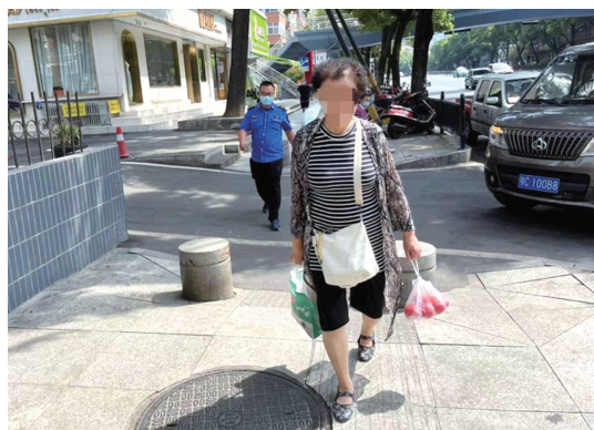
公园路一位阿姨不戴口罩。