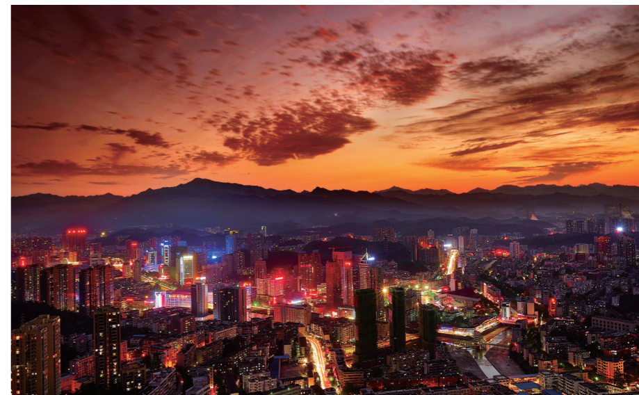
“云山日夕佳，清风衬晚霞。”夕阳西下，映红了天边的晚霞，云彩像着了火一样，是那么绚烂多彩，晚霞和霓虹灯交相辉映的车城愈加迷人。