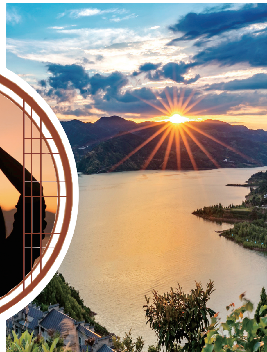
“千里澄江似练，翠峰如簇。”山头如镶金边的落日，光芒四射，湖水泛起微波，点缀着细碎的光，像梦境一样缥缈深邃。