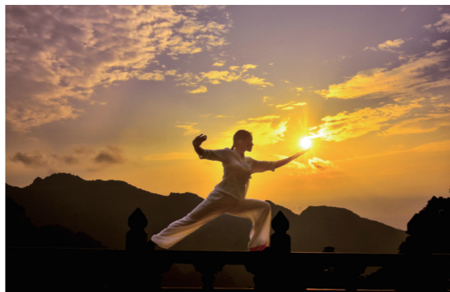
“云光侵履迹，山翠拂人衣。”阳光穿过云层，霞光漫天，人与落日融为一体，别有一番意境。