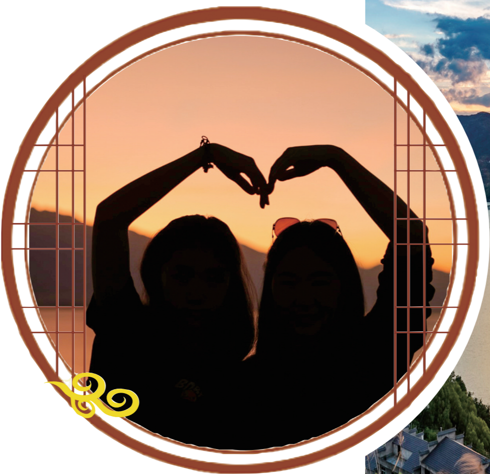
“日落西山头，人约黄昏后。”想和你看着落日，只谈微风和晚霞。