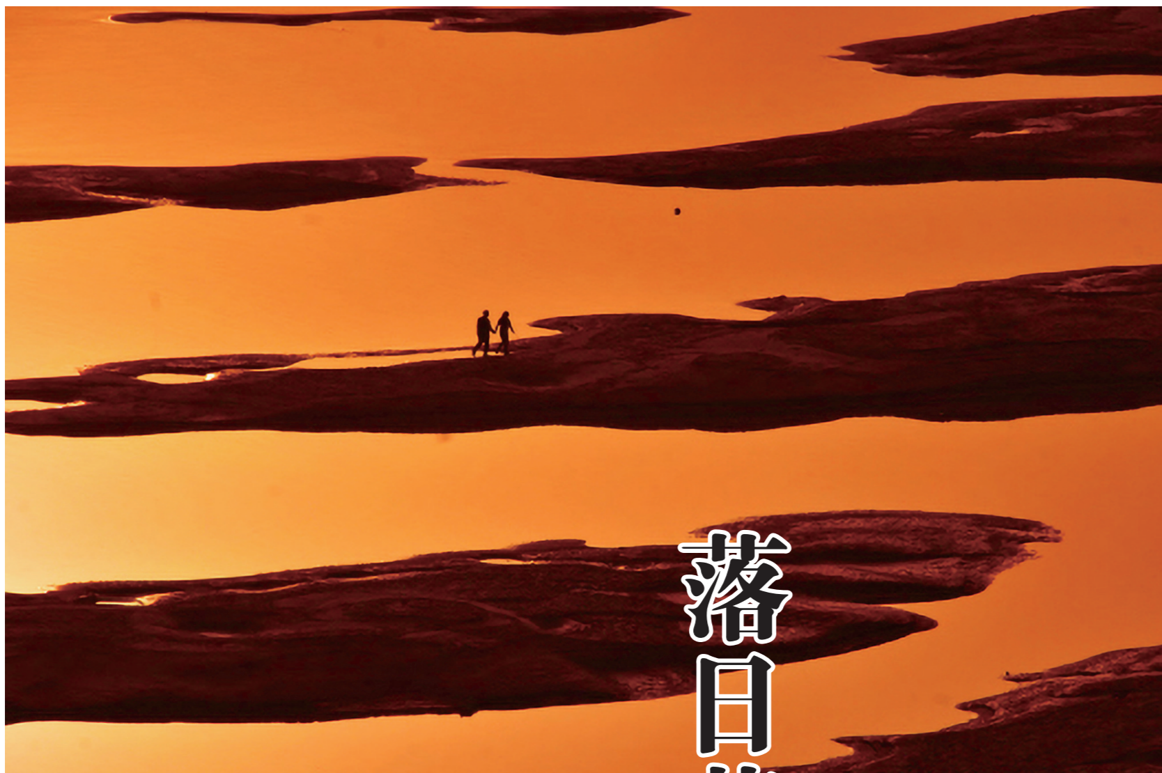
“一道残阳铺水中，半江瑟瑟半江红。”夕阳西沉，晚霞映江，水面像丝绸一样柔和，微荡着涟漪，勾勒出一幅宁静致远的画面。