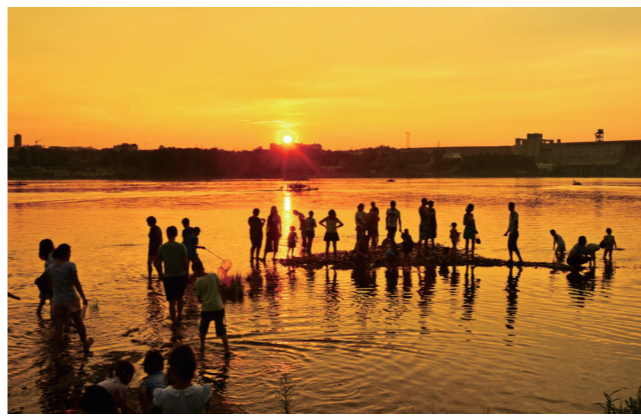
“残霞明灭日脚沈，水面浮空天一色。”夕阳给天地镀上了一层金黄，此刻不如和夕阳来一次浪漫的邂逅。