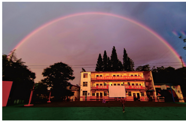
“谁把青红绒两条，半红半紫挂天腰。”雨后的黄昏，彩虹似桥，这是谁也无法抵挡的心动啊！