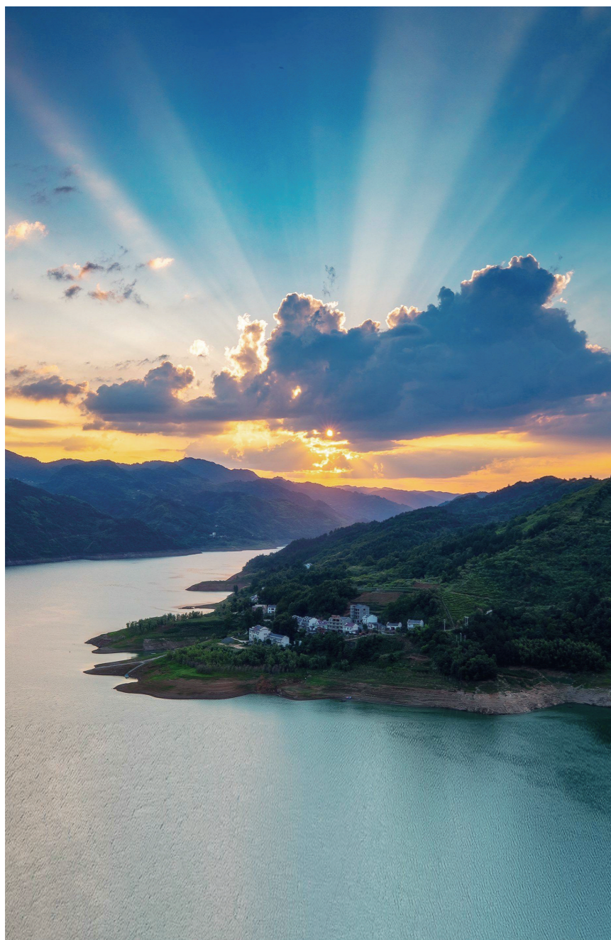
“落日多情还照坐，山青一点横云破。”天边燃烧着一片橘红色的云彩，黛色的山峦、碧色的水面，正等着霞光的亲吻。