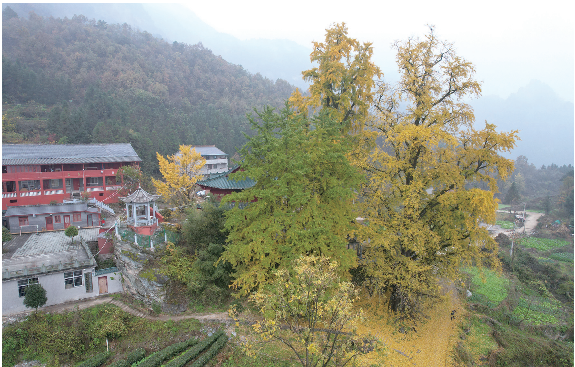
每到初冬，挺拔伟岸、虬枝苍劲的千年银杏，在冬日照耀下满树金黄，美不胜收。