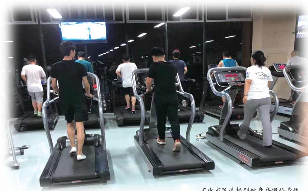
不少市民选择到健身房锻炼身体。