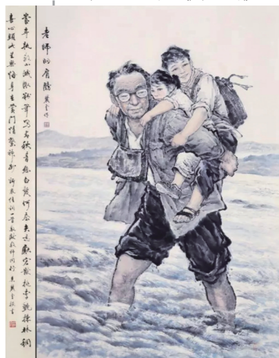
作品《老师的肩膀》体现了莫老深厚的画功，画面直击观众心灵。