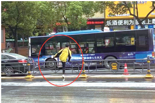
在公园路,一名男子翻越路中间的护栏横穿马路。

记者在现场发现,张湾市民之家前的凯旋大道车流量较大,20分钟的时间里,至少有20位市民横穿马路。另外,张湾市民之家门前的无障碍停车位上,停满了摩托车和电动车。