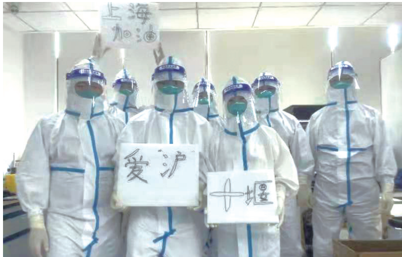
十堰援沪医疗队部分队员打出“爱沪十堰”的标语。