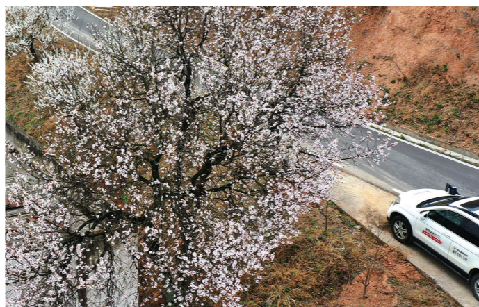
杏花点缀着寻常人家的房前屋后或是乡野道路，也点缀着诗词歌赋里的山水田园。

杏花与黄土地最是亲切，思乡之人的脑海里，一缕杏香总是无法磨灭的记忆。透过花丛望过去，几名农民正在杏花掩映下的春田劳作，成为一幅自然天成的田园风景。