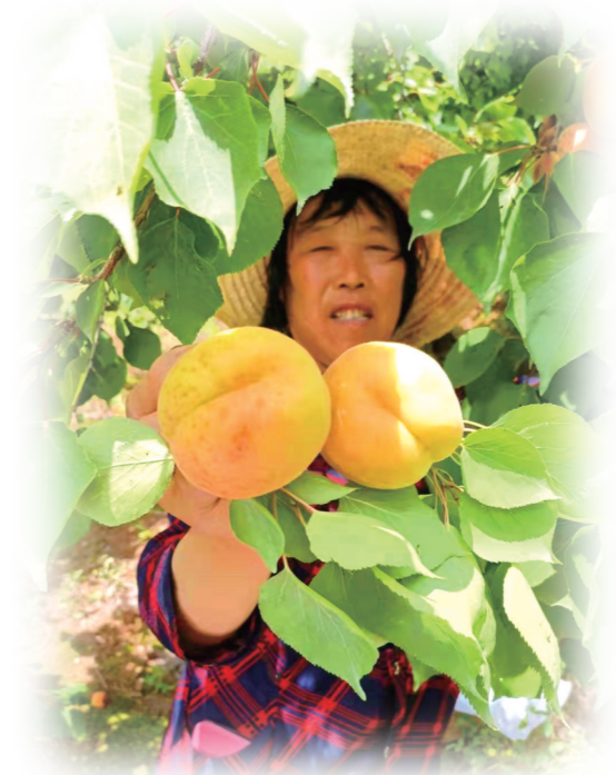
麦收时节，满树黄杏成了农民致富增收的“金果果”。