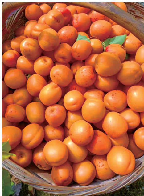
当地食用杏个大形圆、皮薄肉厚、甜酸适口。