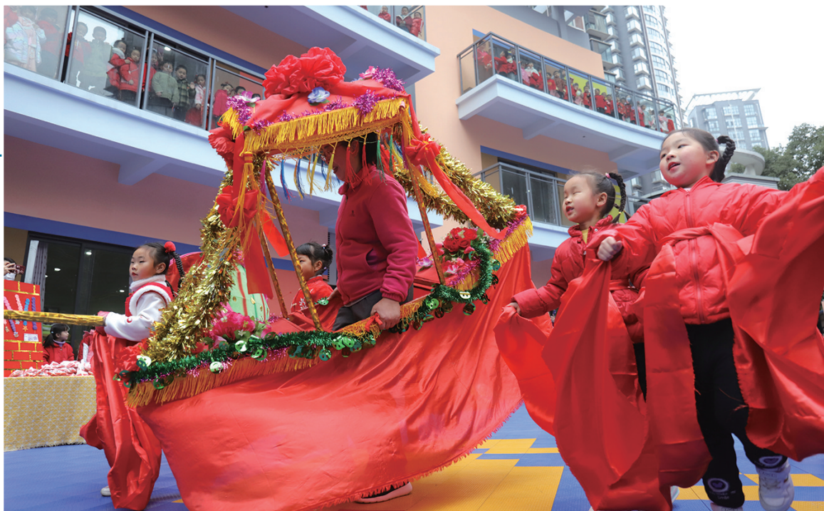
东正幼儿园的小朋友和老师一起玩船灯。