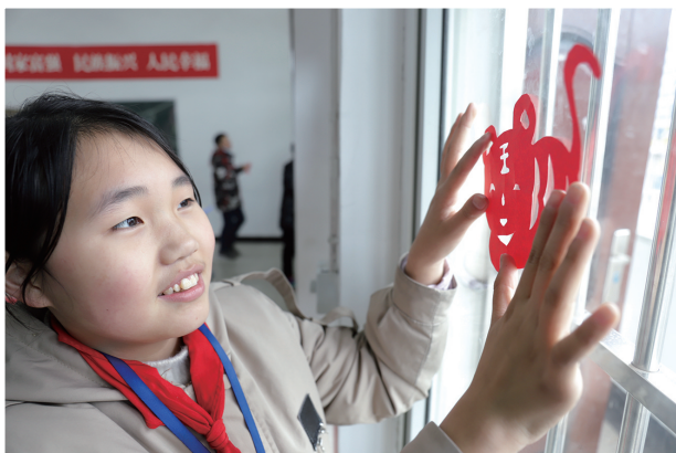
茅箭区许家小学的学生在教室里贴窗花。