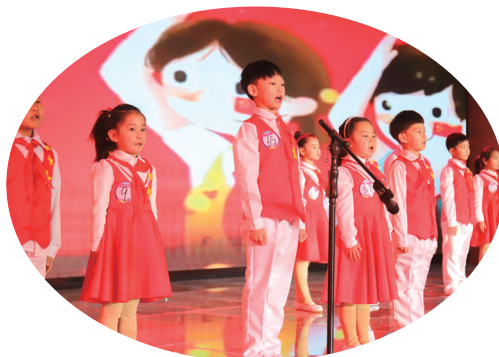
语言艺术单元,选手们集体诵读。

童心向党筑梦想,起航奋进新征程。“环球港杯”十堰首届少儿形象大使选拔赛将为我市少年儿童打造一