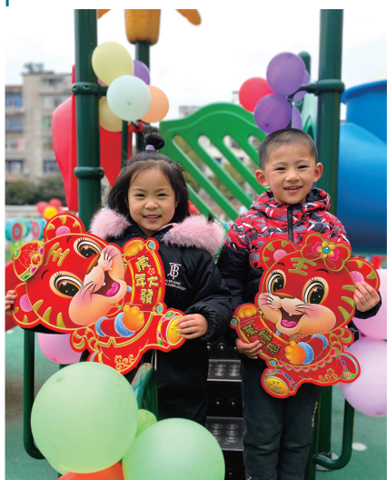
郟阳滨江新区幼儿园,孩子们用虎年门贴迎新年。