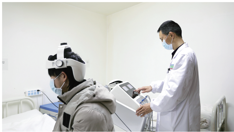
医护人员悉心为患者进行治疗。