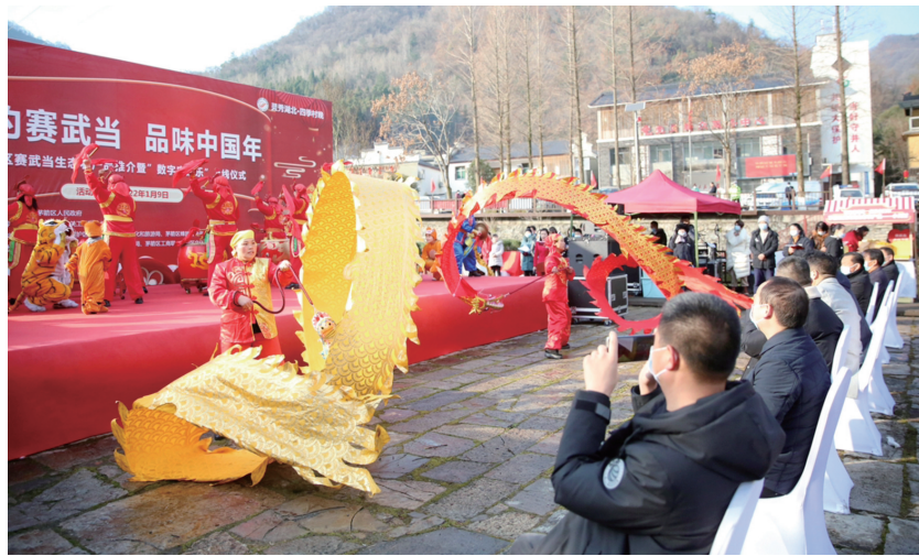
极具地方特色的表演为现场营造了浓厚氛围。

本次活动由茅箭区政府主办,市直机关工委、市妇联指导,茅箭区赛武当自然保护区管理局、茅箭区文旅局、茅箭区蜂旅融合产业链工作专班承办。活动现场举办了“年味·赛武当”2022年赛武当生态农产品推介开幕式、“乡味·赛武当”年货展销活动及“美味·赛武当”“数字农家乐”上线仪式等,促进茅箭区农文旅融合发展。