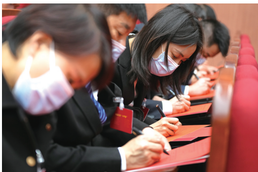
政协委员认真填写选票。