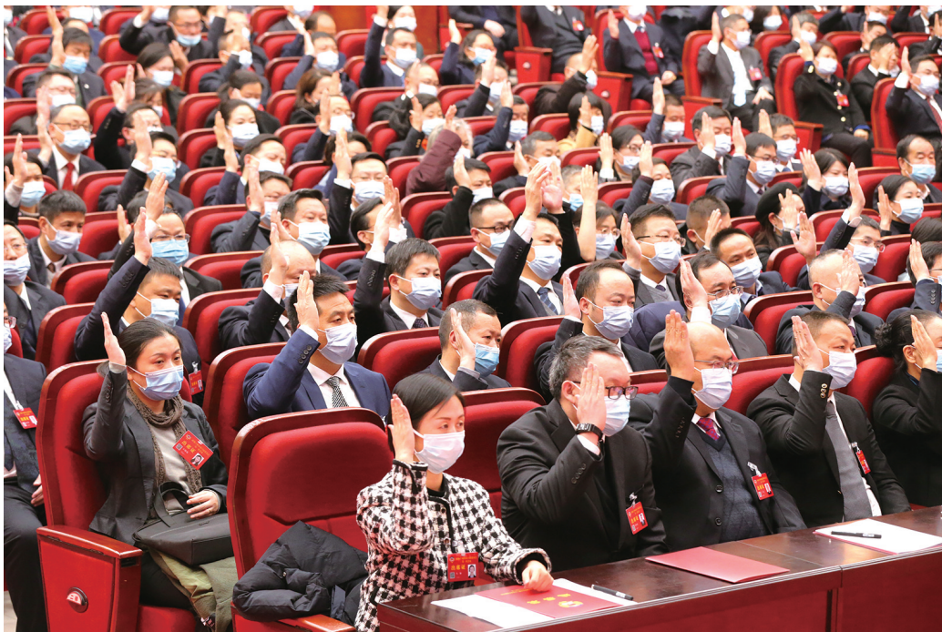
政协委员举手通过提案。