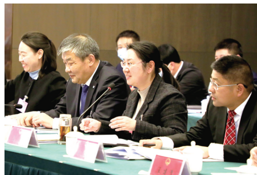
人大代表审议政府工作报告。