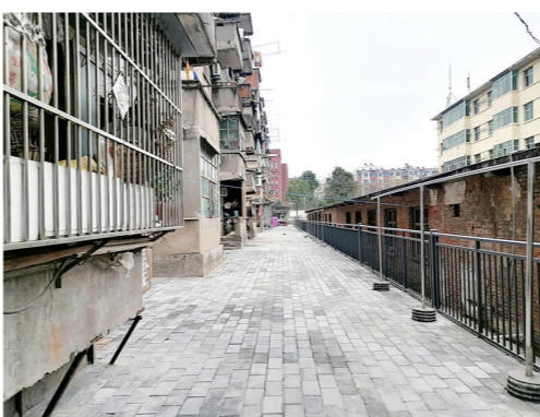
张湾区柏林镇金鼎片区的老旧小区经过综合改造前后。