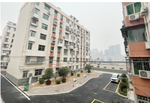
银河山庄小区改造前后。