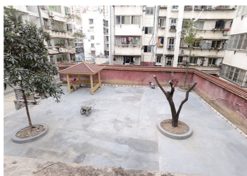
茅箭区五堰街办北街社区北街15号的小区改造前后。