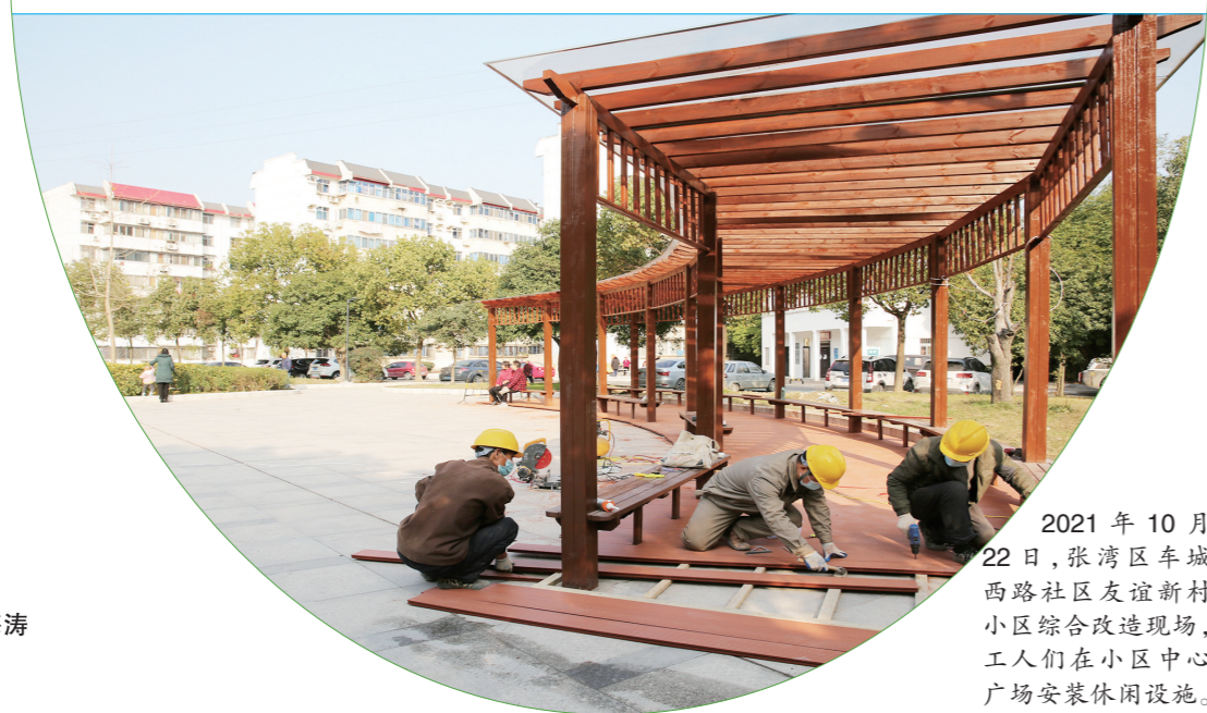
2021年10月22日,张湾区车城西路社区友谊新村小区综合改造现场,工人们在小区中心广场安装休闲设施。