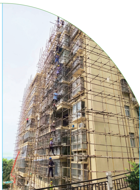
2021年7月17日,郧阳区城关镇香港花园小区一栋综合改造好的楼房外,工人们冒着高温拆除脚手架。