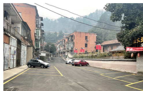
百货站家属区改造前后。