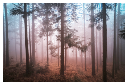
秦家坪冬日美景。