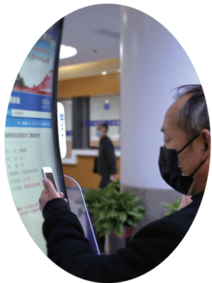
自助挂号机可完成挂号、缴费等操作。

在神经疾病诊疗中心影像中心,配备有一台移动CT、一台128层螺旋CT、一台1.5T磁共振,年底将会有2台超高端影像设备投入使用,分别是3.0T磁共振和256排CT。“3.0T磁共振对中枢神经系统病变的显示有独到优势,且成像速度快,适合全身各系统的扫描。256排CT则实现自由心率下的心脏和冠脉解剖成像,全身4D动态成像,心脑血管联合扫描等