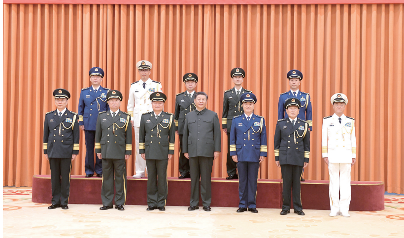
9月6日,中央军委晋升上将军衔仪式在北京八一大楼隆重举行。