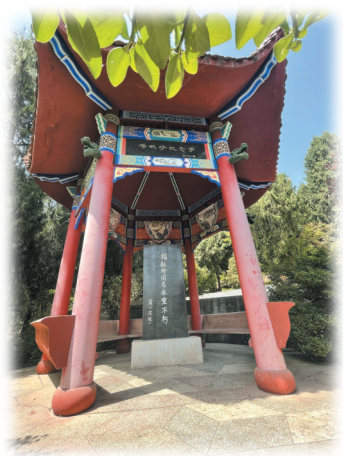
郧阳革命烈士陵园里的杨献珍纪念碑。