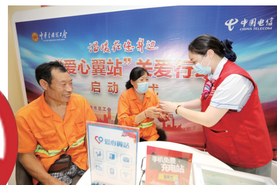
环卫工人“爱心翼站”歇脚。 图/记者 刘成臣 张启国