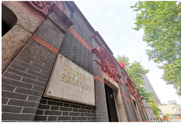
在上海法租界望志路106号，1921年7月23日召开了中国共产党第一次全国代表大会。