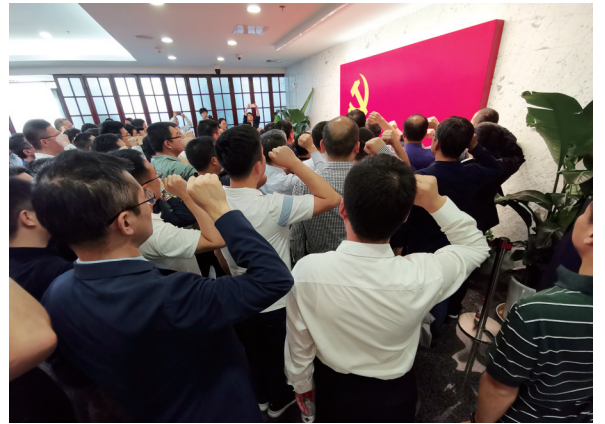
重温入党誓词，牢记使命，不忘初心。