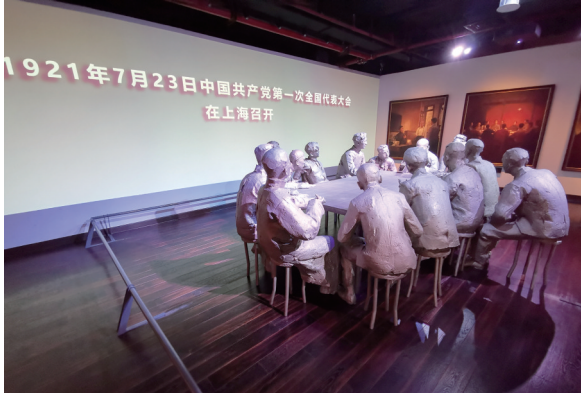
中共一大纪念馆再现了中共一大召开的历史场景。