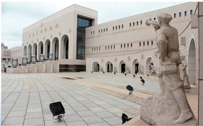
延安革命纪念馆是新中国成立后建成的最早的革命纪念馆之一。