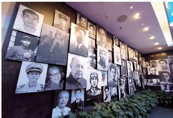
中共一大纪念馆里悬挂着多位革命先烈和为共和国建设作出突出贡献的先进人物照片，生动展示了中国共产党的诞生历程和新中国建设进程。