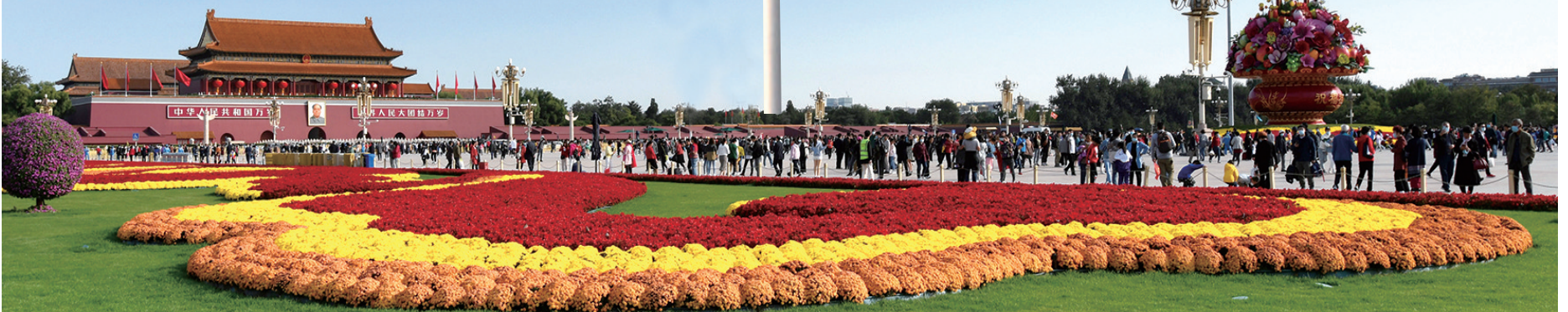
天安门广场吸引着全国各地的人前来参观游玩。