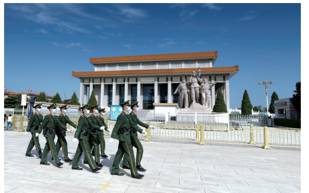
毛主席纪念堂是以毛泽东同志为核心的党的第一代革命领袖集体的纪念堂，是全国爱国主义教育示范基地。