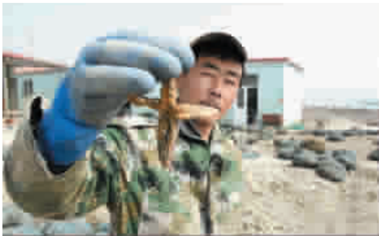
渔民展示捕捞的海星。