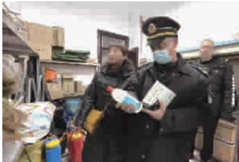
执法人员认真查看学校的防疫物资是否合格。